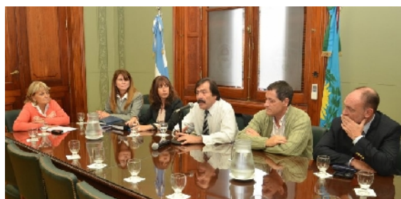
Subsecretaría de Atención a las Adicciones