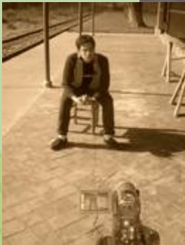
Comunidad Terapéutica Santo Tomás. Carlos Casares