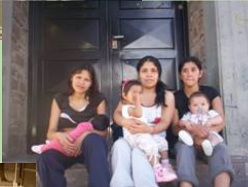
CPA Villa Itatí. Quilmes